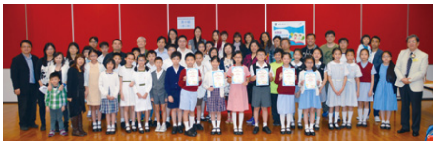
高小第二組全體參賽同學、家長、老師及評判。