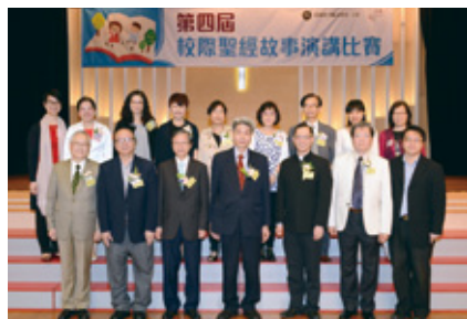
所有評判、主禮人及出席協助的中華基督教會區會小學校長們。

比賽分三個級別,包括:初小組(小一及小二)、中小組(小三及小四)及高小組(小五及小六)各兩組,共六組,每組設冠、亞、季軍各一名及優異獎三名。得獎名單及比賽花絮已上載到本社網頁,歡迎到 www.cclc.org.hk 瀏覽。