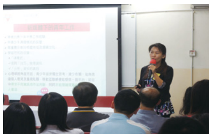
王蓉小姐認為青少年上網未必與沉溺扯上關係，父母應嘗試進入子女的世界，了解他們。

是次講座為「人間基督教·說書會」系列，講座分享及答問內容將會結集成書，請密切留意本社最新消息。