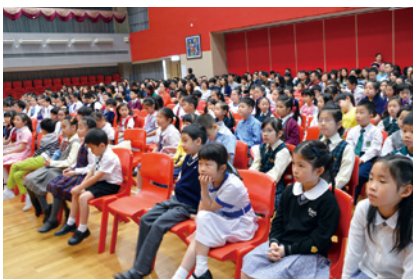
近三百位同學及家長出席今屆比賽。