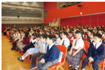
超過二百位同學及家長出席。