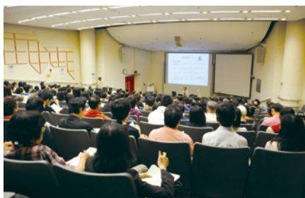
近 300 人出席是次「說·書·會」。