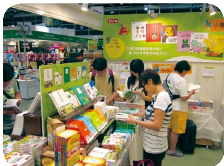
我們的閱讀空間，讓讀者尋找心頭好。