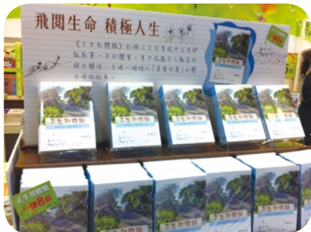
《正生初體驗》是今屆書展本社銷量之冠。