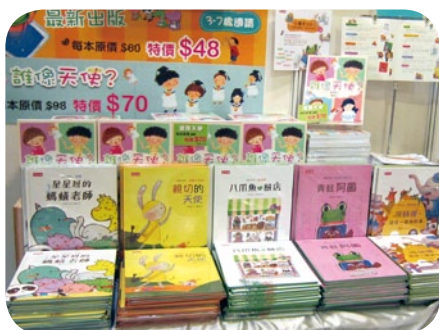
新出版的精美童書《誰像天使？》及「小專才系列」深得小讀者愛戴。