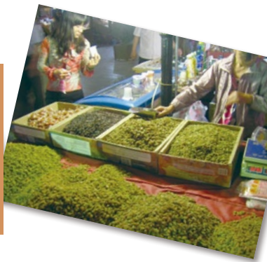
沙洲夜市售賣 葡萄乾的攤檔

危機。記述角度切身，可以見到研究環境的惡劣和當時敦煌文化在近代中國史中所面對的磨難。而學者們在缺乏支援的處境下仍不減對敦煌文化的熱愛和堅持，教人深感動容和敬佩。三毛的〈夜半逾城——敦煌記〉，則貫徹作者浪漫奔放的風格，展現三毛與莫高窟內宗教神明的感通。其他的文章或記述敦煌的地理風光如鳴沙山、月牙泉，或敦煌的文化遺蹟，皆呈現了敦煌氣質的不同面向。若想初步感受敦煌的人文氣息，而非單單資料性層面的認知，這本散文集會是個不錯的選擇。