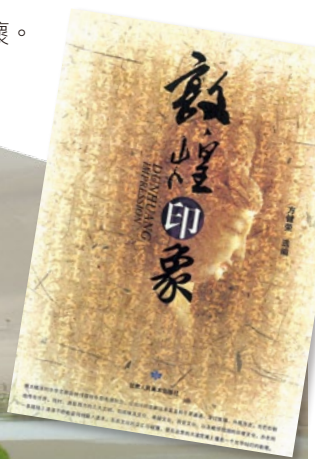
方健榮選編：《敦煌印象》 蘭州：甘肅人民出版社，2009。