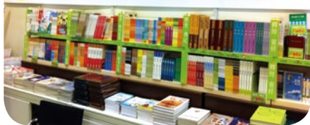
我們的出版能伴你飛越人生高低。