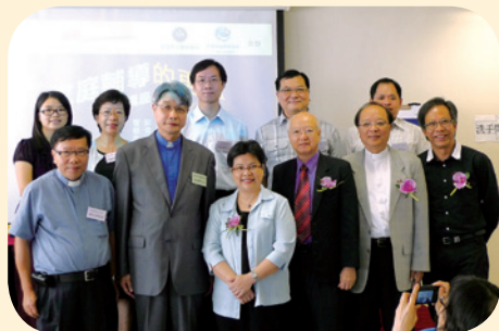
社長（前排左二）與是次講座嘉賓及工作坊講員合照。