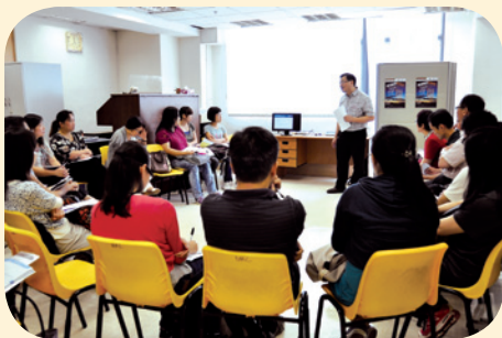
工作坊分為六個主題，由專人帶領探討。