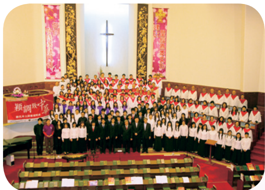
近 200 人的詩班隊伍，為主獻上美妙的詩歌。