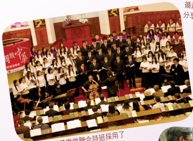
浸大、嶺大及善樂堂聯合詩班採用了 中西樂器伴奏，令音樂更豐富。