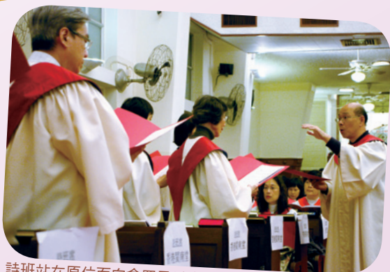
詩班站在原位面向會眾及以方言獻唱， 是這次頌唱會的特色。