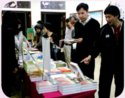
聚會開始前，會眾爭取時間選購喜愛的書籍。