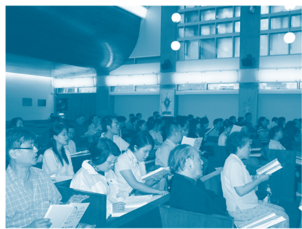
參加者人手一本普天頌讚新修訂版旋律本，投入於頌唱讚美中。