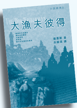
達加斯 著 呂迺瑛 譯 2007年 616頁 小說經典3

本書是作者達加斯最後一部小說創作，將粗魯的大漁夫彼得，從迷惘中頓悟，親受神蹟奇事的震撼，蛻變成教會的奠基者等事蹟一一描述出來。其文辭的優美，筆鋒的靈動，情節佈局的仔細，以及人物血肉的分明，梳理出驚世鉅著，誠為長篇小說的典範。