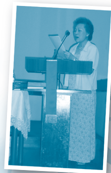
林師母即場獨唱示範。