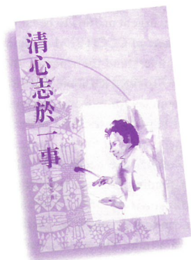
祁克果著 靈花系列5 2002年 203頁

像，以為可以在樹林中躲避上帝。現在人也許是更容易、更方便、也更怯懦地，把自己躲藏在人群之中，希望上帝在群眾中不能分辨甲或乙。但在永恆中，每個人都要各自交賬。那就是說，永恆要求著每一個人，就他自己的一生獨自負責。那早在自己的洋洋得意中忘記了自己的人，永恆要把他所行的一切事——提出來擺在他的意識之前。那想躲在群眾中，以為在那裡不會嚴格算賬的，到了永恆的國中，就會被交出來嚴格報賬。各人必須在上帝面前負責報他自己的賬。帝王也必須報他自己的賬，赤貧的乞丐也只要報他自己的賬。無人可以驕傲以為自己是超乎個人之上，更沒有人可以徬徨失措地想著，他在世上只匆匆忙忙地在眾人中備數，甚至連一個名分都沒有，所以他不算是一「個人」。