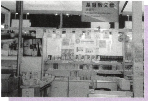
二〇〇三台北書展中本社攤位。 Our booth in 2003 Taipei Bookfair.

二月九日至十七日社長、發展顧問及同工共四人前往台北，參加第十一屆台北國際書展，成績美滿。本社出版之釋經書及歷代名著集成甚受歡迎。同時在台北期間，社長及同工先後參觀了華宣出版社、校園出版社、貿騰發中介公司及中華福音神學院、衛理會禮拜堂等機構。