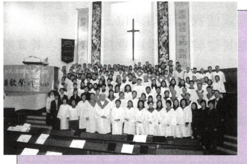
「樂歌榮神」聖樂崇拜八個詩班大合照。 All church choirs at the 'HUP Worship'.

We held a 'HUP Worship' at the Kowloon Methodist Church on January 25, 2003. There were more than 300 attendants. We have invited seven church choirs and the Sacred Singers to perform and lead the audience to sing. The choirs and the audience all enjoyed the worship very much. We are planning to hold a sacred music seminar in May, 2003.