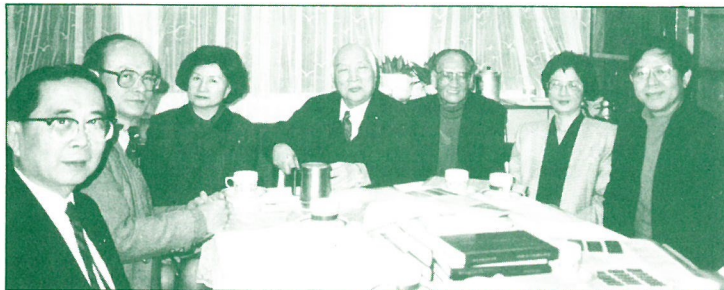
本社第十六次年會會議一角