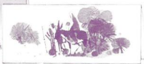
No. 2216. 3