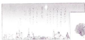
No. 2216. 2