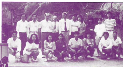
退修會同工合攝於大嶼山衛理園 Staff retreat at Methodist Centre, Lantau.