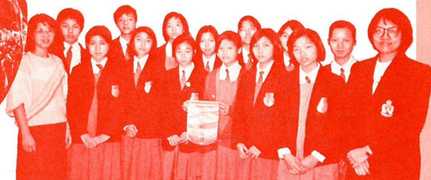
顧超文中學師生訪問本社