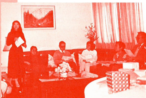
同工聖誕聯歡會一角

本社有下列職位： 倉務主任、司機、助理司機兼送貨、推廣營業員。 有意應聘者，請具履歷、希望待遇、照片函寄本社行政主任收。