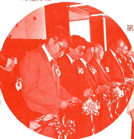
第二屆基督教文化節聯合書展開幕剪綵