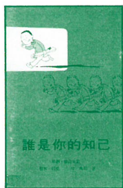
How to be Your Own Best Friend by Mildred Newman & Others