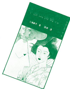
Deiryu Chitai Part 1 & 2 by Ayako Miura