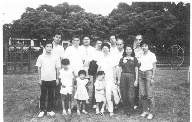
本社同工與眷屬攝於浸會園 CCLC Staff took an outing to Fanling

九月三十日適值中秋節翌日——公眾假期，社內同工齊至粉嶺浸會園旅行，到達目的地後即有各項活動，包括靈修，慶祝生日會，集體遊戲，自由活動等，浸會園地方寬敞幽靜，使各同工倍感身心舒泰。