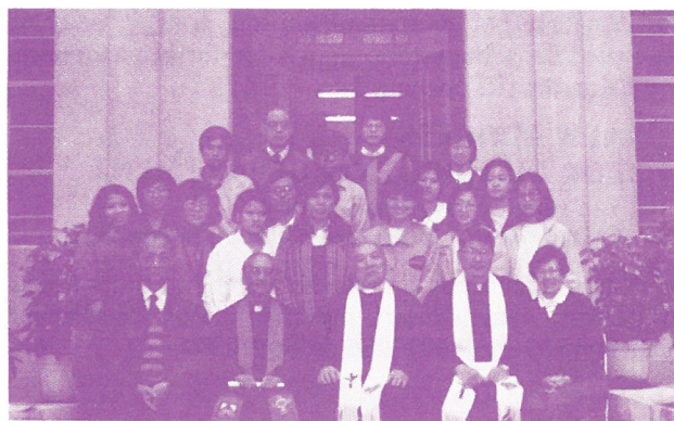
同工與董事同領聖餐後，攝於何福堂會所門前。 Staff and Executive Committee members at the Staff Retreat in Hoh Fuk Tong.

韓德爾（G.F.Handel）所寫的神曲「彌賽亞」（Messiah）是音樂的奇珍。自從韓德爾以二十四天的驚人速度寫成了這首原稿長達三百五十四頁的不朽傑作以後，到現在已經過了二百四十多年，可是每年在世界各地，仍然有許多合唱團及教會詩班演唱這首「彌賽亞」，並且一直都受歡迎，本社每次印行，不久即告售罄，現再大量供應，愛好音樂者應及早購備。